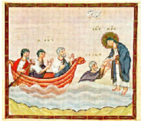
Illustration av söndagens evangelieläsning. Bilden är gjord av Okänd och finns i Codex Egberti, Fol 27v, Public Domain, hämtad via: https://commons.wikimedia.org/w/index.php?curid=8096745

över allting på jorden. Det är bilden av Jesus som den gudomliga som blir tydligast, att han till och med i stormens öga och vår största nöd kan hjälpa. Rubriken för denna söndag var i 1983 års evangeliebok "Jesus har makt att hjälpa" den rubriken, och rubriken i den Evangelisk-lutherska kyrkan i Finland för denna söndag, "Jesus hjälper i nöden", ger enligt mig en bättre beskrivning av innehållet i texterna. 1